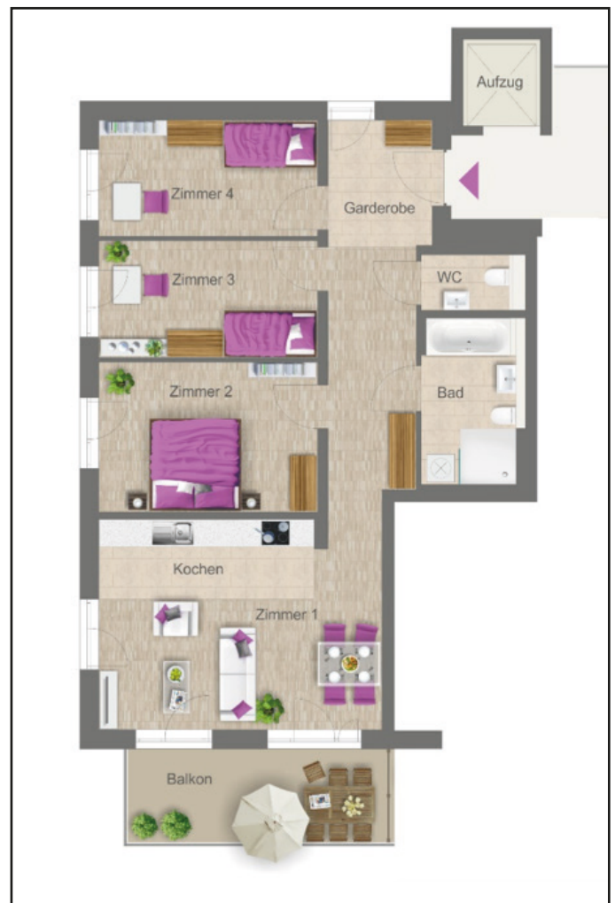
Wohnungsbeispiel 4 Zimmer Wohnung, 94 m 2 , 2. OG