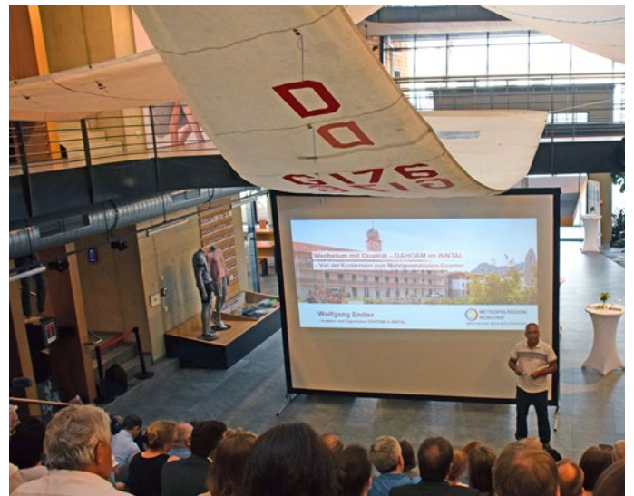
Impressionen zu unserer Veranstaltung in Kooperation mit der Metropolregion München e. V. im Rahmen der Veranstaltungsreihe der Regionalen Wohnbaukonferenz bzw. des „Preis für Baukultur“.